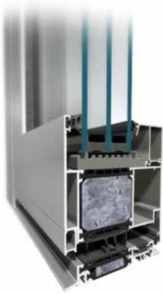
Deuren MB-104 Passive SI