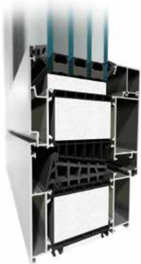
MB-104 Passive Aero