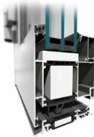
Deuren MB-104 Passive Aero