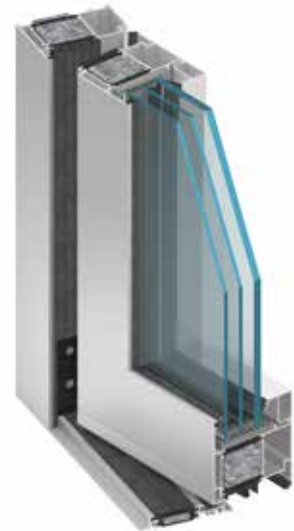
Deuren MB-104 Passive SI, RC3

Voorbeelden van warmtedoorgangscoefficienten U_D